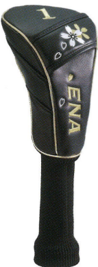
● MagicWand-SF ヘッドカバー