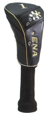
●EG-01 ヘッドカバー付き

*高反発モデルはヘッドスピード40m/s以上の方は使用しないでください。(ヘッド破損のおそれがあります)